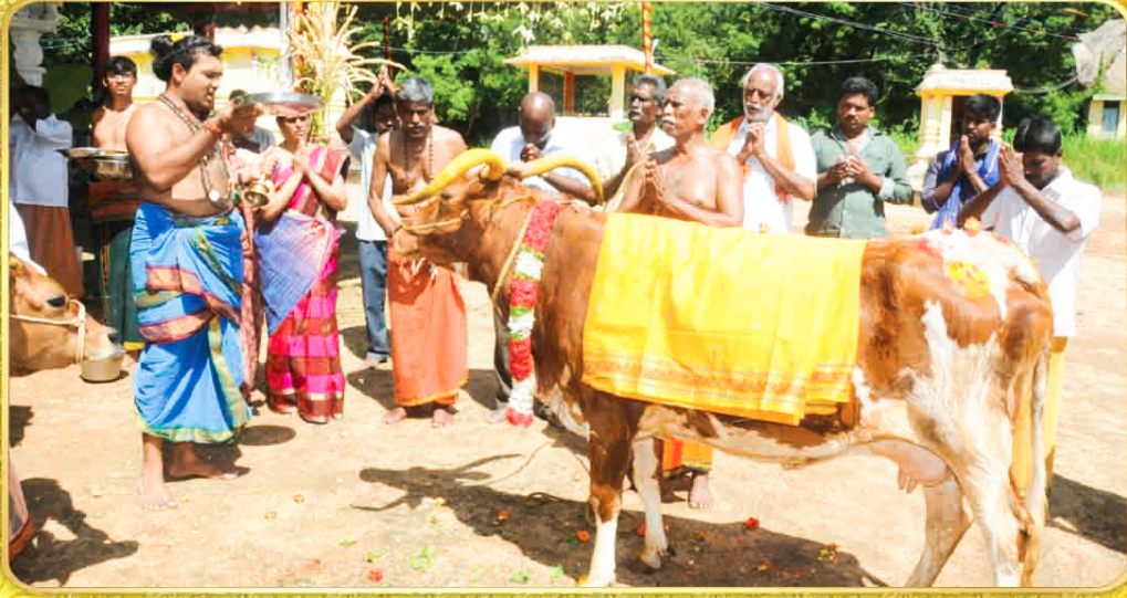
பால் சுரந்து ஜோதிர்லிங்க உத்பவ இடத்தை அடையாளம் காட்டிய பசு